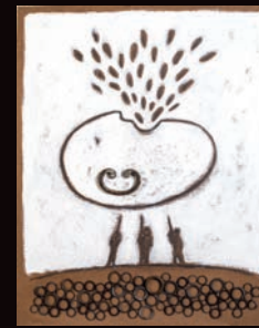
SENZA TITOLO 2 TECNICA MISTA SU CARTONE, 60X100