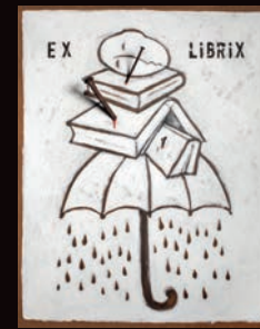
EX LIBRIS TECNICA MISTA SU CARTONE, 60X100