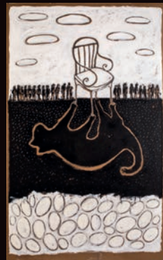
SULLA STESSA SEDIA TECNICA MISTA SU CARTONE, 100X180