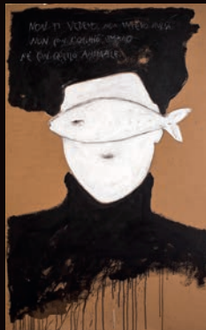
NON TI VEDEVO TECNICA MISTA SU CARTONE, 100X180