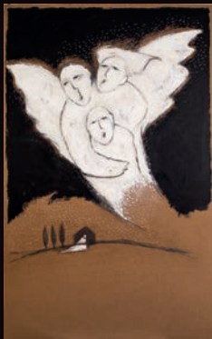
ANNUNCIAZIONE TECNICA MISTA SU CARTONE, 100X180