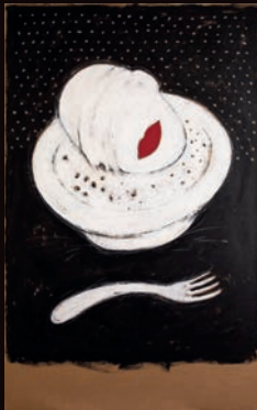
NEL MIO PIATTO TECNICA MISTA SU CARTONE, 100X180