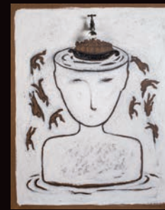
VITTIME TECNICA MISTA SU CARTONE, 60X100