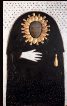
LA MADONNA NERA TECNICA MISTA SU CARTONE, 100X180