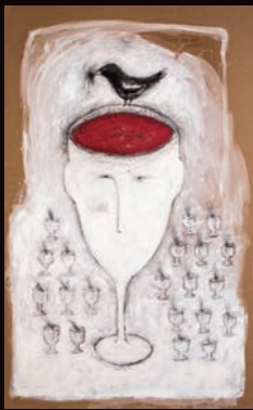
SANGUE DEL TUO SANGUE TECNICA MISTA SU CARTONE, 100X180