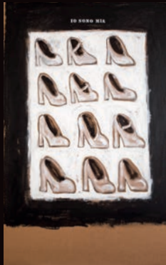
IO SONO MIA TECNICA MISTA SU CARTONE, 100X180