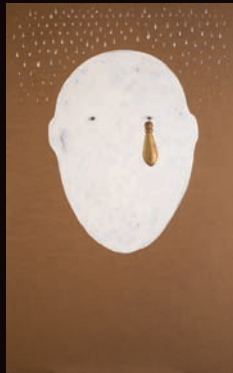
SENZA TITOLO TECNICA MISTA SU CARTONE, 100X180