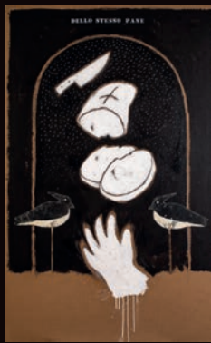
DELLO STESSO PANE TECNICA MISTA SU CARTONE, 100X180