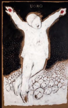
UOMO TECNICA MISTA SU CARTONE, 100X180