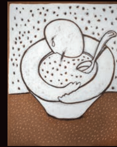
LA VITA È NEL LUOGO DOVE TU VERSI IL BRODO TECNICA MISTA SU CARTONE, 60X100

SALETTA NOLFI, CHIESA SAN PIETRO IN VALLE, FANO 21 GIUGNO / 16 LUGLIO 2017