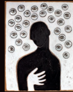
SENZA TITOLO 3 TECNICA MISTA SU CARTONE, 60X100