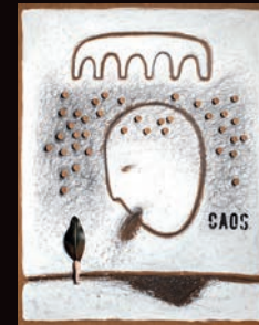
CAOS TECNICA MISTA SU CARTONE, 60X100