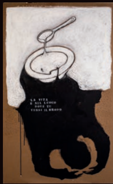
LA VITA È NEL LUOGO DOVE TU VERSI IL BRODO TECNICA MISTA SU CARTONE, 100X180